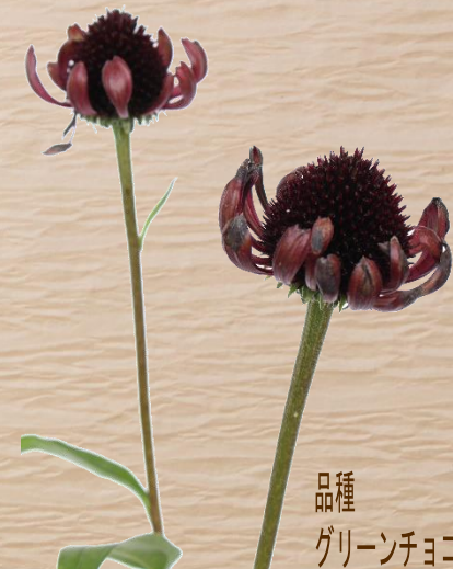
品種 グリーンチョコ

左から順に、農場開花中→開花から3週間ほど経過→切花 露地栽培で遮光など特別な管理はしていません 外縁の花弁が下垂せず、上向きに反ってくるタイプの様です