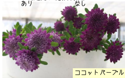
ココットパープル