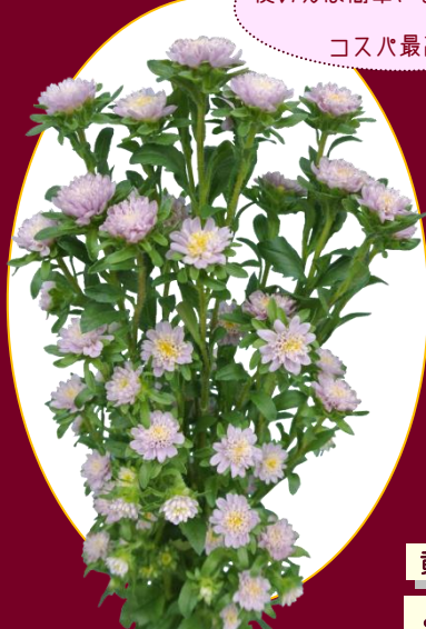
ココットラベンダー